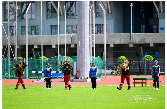
Foto 5 - kandmine ja üleandmine - koerajuhid võtavad oma koera laua pealt sülle, kõnnivad 10 sammu kandjani ning annavad ta võõrale inimesele üle. Kandja kõnnib seejärel omakorda 10 sammu ning paneb siis koera maha. Koer peab jääma liikumatult oma kandja juurde seni kuni koerajuht annab oma koerale loa enda juurde tagasi tulla.

Üldjoontes oli sooritus tõesti harmooniline ja korralik. Leidus omajagu väiksemaid tehnilisi vigu (alg- või lõppasendi mittevõtmine, korduskäsk jmt), mida mõistagi hinnatakse maailmameistrivõistlustele kohaselt karmilt ja õiglaselt. Kokku saime 155 punkti 200-st ehk 78% maksimaalsest.