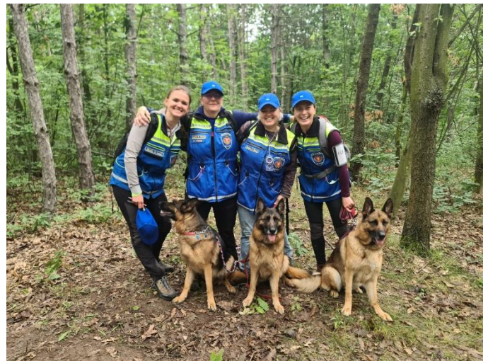
Foto 9 - Õnnelik meeskond pärast otsinguosa tulemuse teada saamist

Ülejäänud päev kulges teiste meeskondade tulemusi oodates. Pinget jagus kuni võistluse viimase kuulekuse ja osavuse soorituseni – Sloveenia tiim, kes oli teinud väga kõrged punktid maa-alaotsingus. Kui esimesed lõplikud tulemused hakkasid selguma olime õnnelikud, et viimaste hulka me ei jää, kuid mida aeg edasi nägime, et oleme juba tabeli esimeses pooles