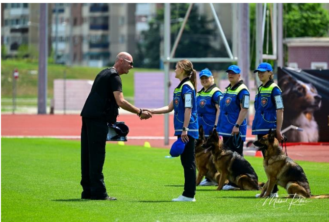
Foto 4 - kuulekuse soorituse alustamise raporteerimine kohtunikule

Hiljem tunnistasime üksteisele, et sellest hetkest kadus meil kõigil pinge. Tundsime end hästi, sest olime sinna jõudmiseks endast maksimumi andnud ning nüüd oli aeg ilus etteaste teha.