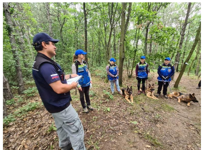
Foto 12 - Maa-alaotsingu staabis meeskonda kohtunikele tutvustamas

Maa-alaotsingut hindab korraga 3 kohtunikku – iga kohtunik ühte koera ja koerajuhti. Iga leitud inimese teatamise eest on võimalik saada 60p (kokku leidude eest seega 180p). Lisaks on võimalik saada meeskonna kaptenil otsingutaktika ja selle elluviimise eest 50 punkti ning meeskonna koostöö ja distsipliini eest 30 punkti. Maksimaalne punktisumma on 260p.