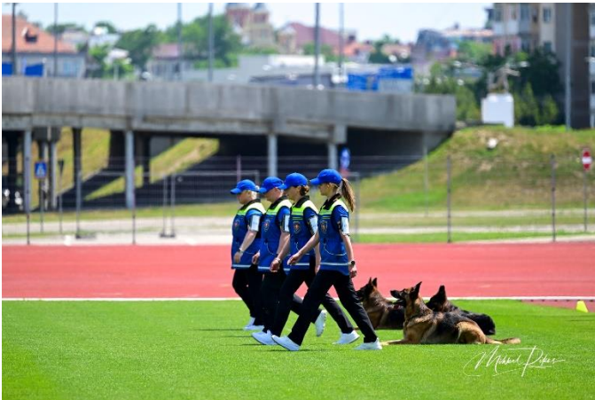
Foto 6 - Lamamine häiritud olukorras

FCI meeskondlikel päästevõistlustel ei ole kuulekuse ja osavuse ega maa-alaotsingu soorituse läbimiseks miinimumtasel määratud. See tähendab, et kogutud punktid ja tulemus läheb arvesse igal juhul ning lõpparvestuses on kõik tiimid. Küll aga tuleb esimeste hulka saamiseks tihedas konkurentsisis pingutada, sest kui sisse tuleb suuri vigu või märkimisväärne osa punkte jääb saamata.