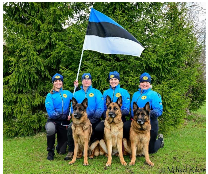
Foto 1 - Eesti meeskond pääste meeskondlikul MM-il

Meeskondlike võistluste tiim koosneb 3 koerajuhist, 3 koerast ja kaptenist ning lubatud on registreerida ka üks varukoer.